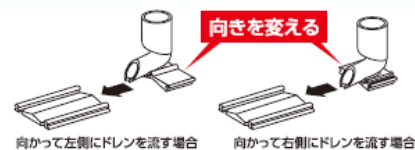
向かって左側にドレンを流す場合 向かって右側にドレンを流す場合