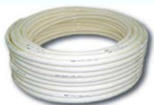
スマートホース40mシングル