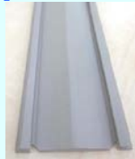
ドレンレール 1本 スマートホース1.5m (継手・パッキン付)