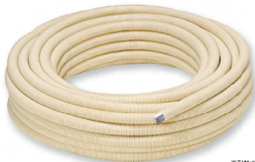
高耐熱ポリエチレン管 (丸サヤ管入ペア樹脂管)