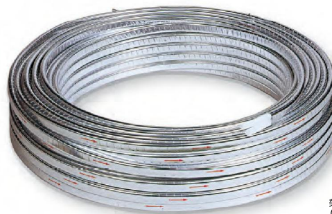
架橋ポリエチレン管 (アルミ巻ペア)