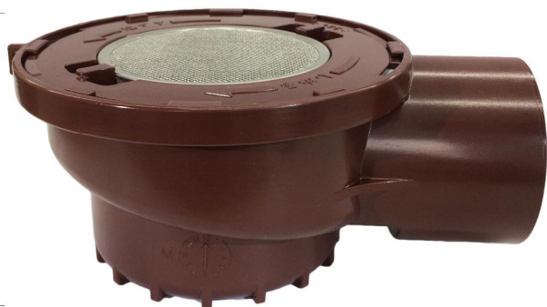
品名：EC耐熱排水トラップ